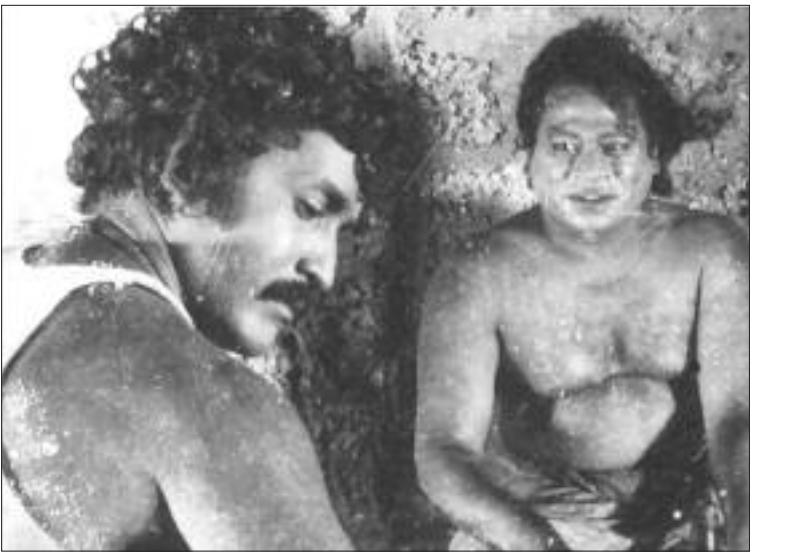
வாடைக்காற்று - சிரைப்படம்