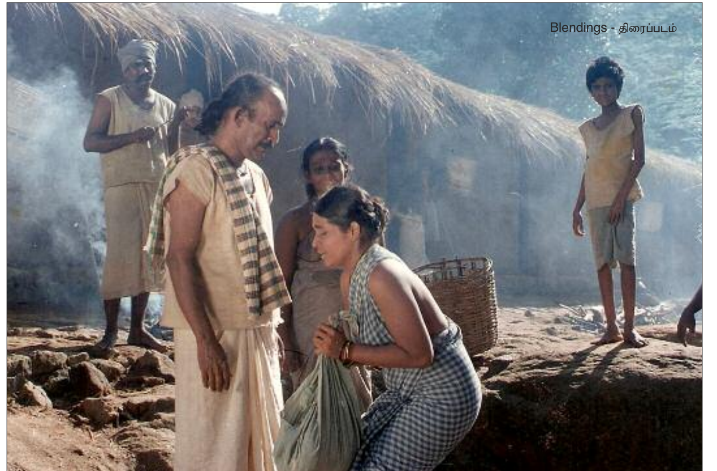
Blendings - திரைப்படம்

படி விடைபெறுகையில் ‘கதை’ மறந்து விடாதீர்கள் என்றார்.