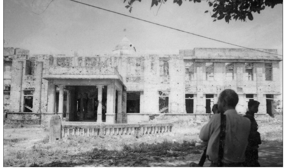
நூலகத்தின் பின்புறத் தோற்றம்