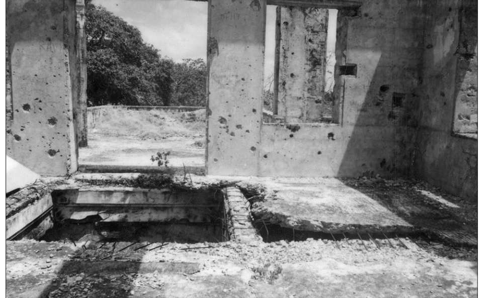
நூலகத்தின் மத்திய பகுதி (மேல் மாடி)