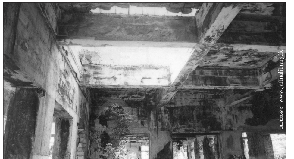
நூலகத்தின் மத்திய பகுதி (கீழ் மாடி)