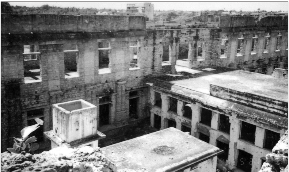
நூலகத்தின் மேற்குப் பிரிவு