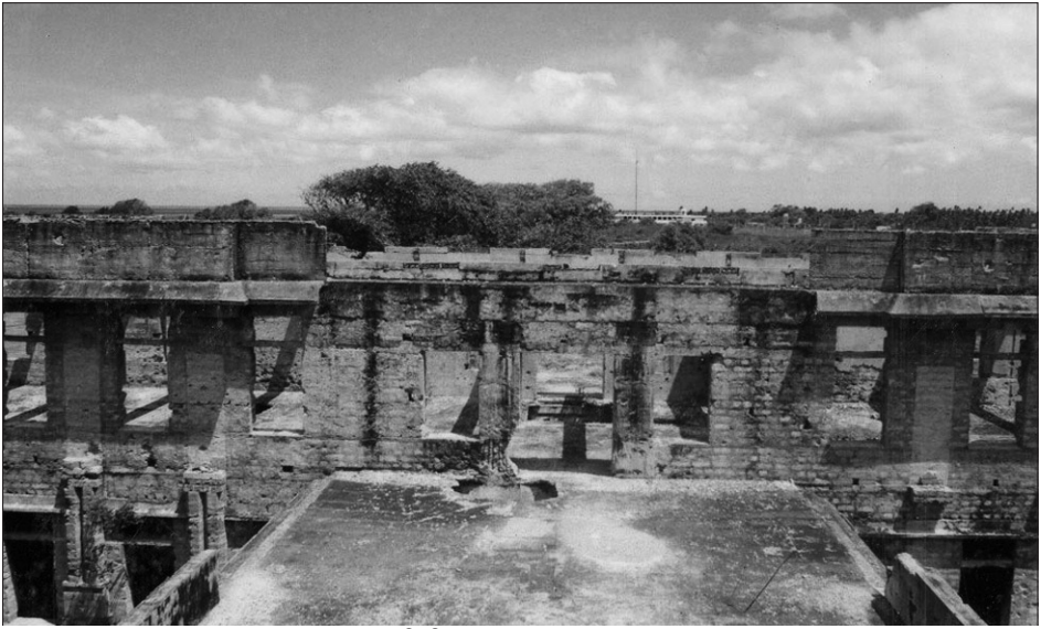
கூரையிலிருந்து பார்க்கும் போது