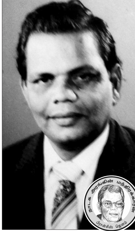
காட்சி நாடகங்களிலும் தொடர்ந்து பங்

இருந்து, அவர் நோய் வாய்ப்பட்டு, கண் பார்வை இழந்து படுக்கையில் இருக்கும் வரை பிரகாசித்ததை நான் கண்டு மகிழ்ந்து, வியந்து, பிரமித்திருக்கிறேன். 1947 முதல் நாடகங்களிலும், 1963 முதல் திரைப்படங்களிலும் வானொலி, தொலைக்