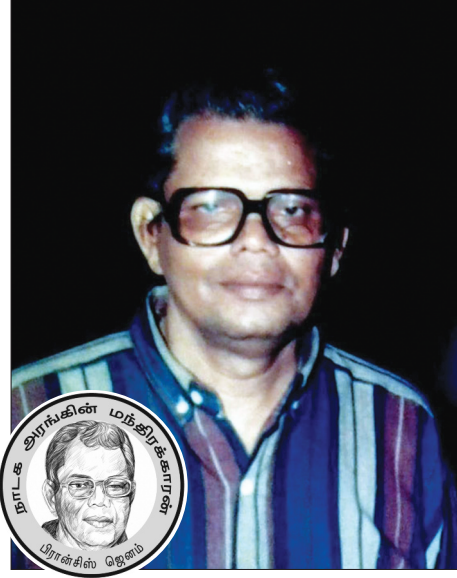
பெளதீக வெளியில் கொண்டுவரக்கூடிய ஆற்றல் சில நடிகர்களுக்கு மட்டுமே கைவர முடியும் என்பதனை கண்டிருக்கி

வெளிப்பட்ட நுணுக்கங்களை அவதானித்தேன். உடலையும் குரலையும் அவர் லாவகமாகக் கையாண்டு, கொடுத்த எந்தப் பாத்திரத்திற்கும் உயிர் கொடுக்கக் கூடிய அற்புதமான கலைஞர் என்பதனை அவதானித்தேன். அவர் ஒரு இயல்பான கலைஞர். அது அவருக்கு இயற்கையின் ஒரு கொடை. ஒரு நெறியாளனின் எதிர் பார்ப்பினை அப்படியே அரங்கம் என்ற