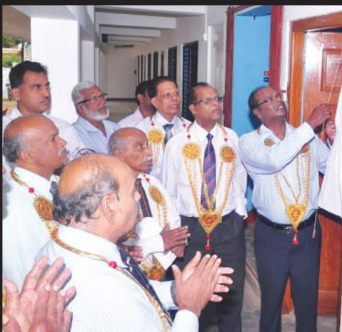
KEYSTONE BLOCK of the renovation by S. Vasanthan & S. Vijayakumar March 2017.