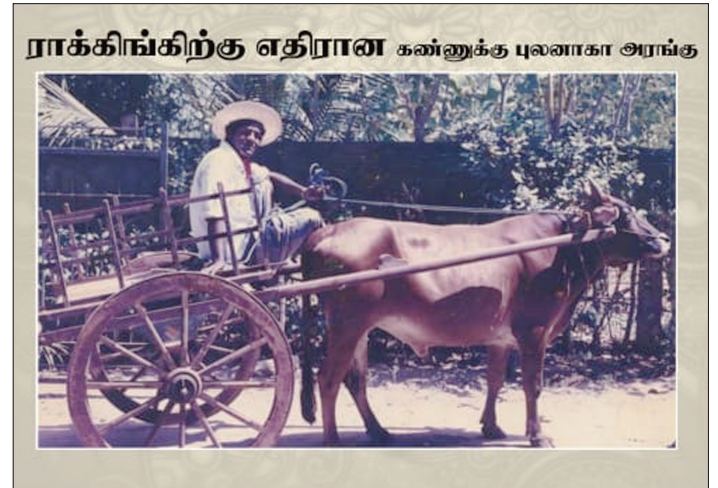
ராக்கிங்கிற்கு எதிரான கண்ணுக்கு புலனாக அரங்கு